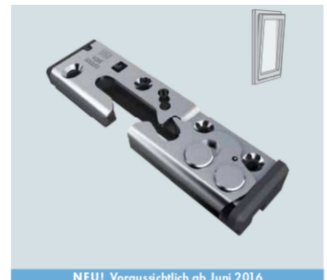
GESICHERTE SPALLLÜFTUNG TITAN vent secure